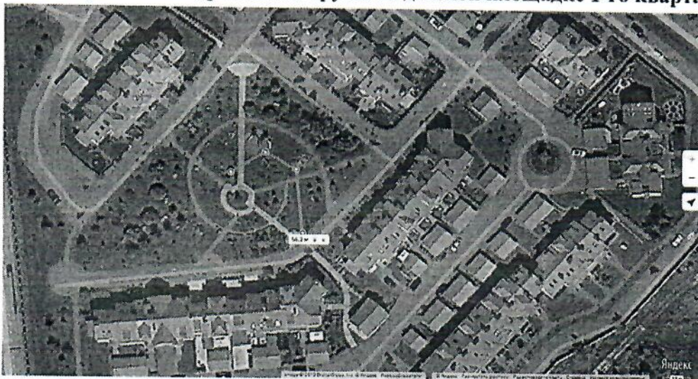
Схема пролегания дренажной трубы на детской площадке 1-го квартала: